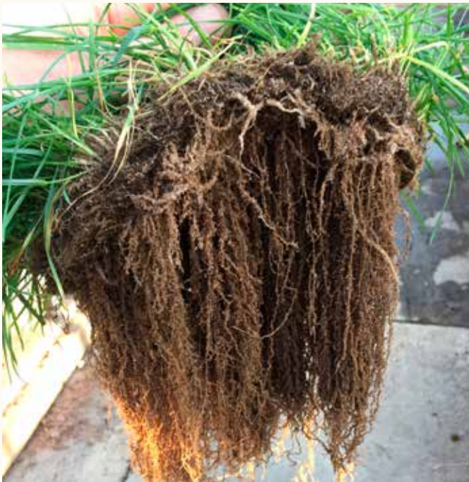
Sierrablen Plus con tecnologia Pearl®