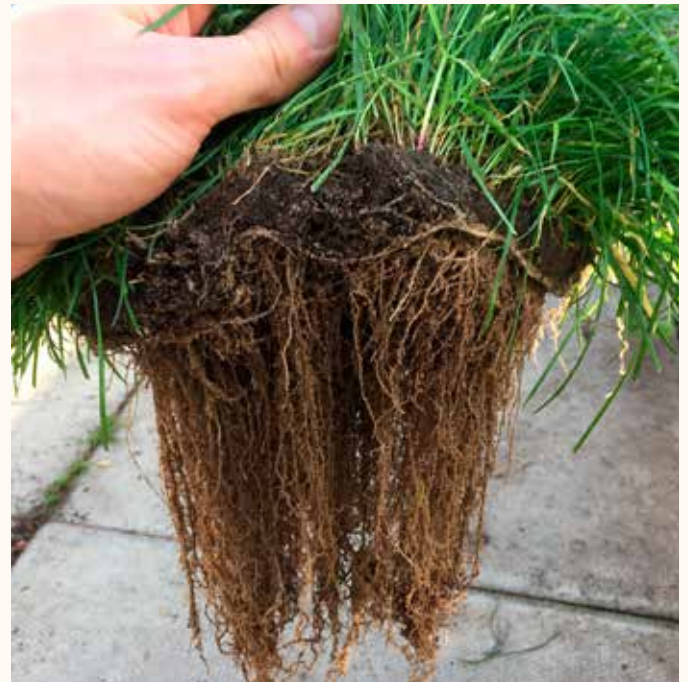
Altro concime ad alte prestazioni